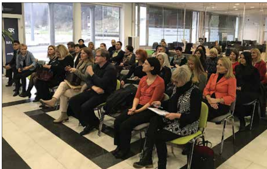
Isbor zanimivih tem so tudi tokrat narekovale spremembe zakonodaje.

Informacijska pooblaščenka Mojca Preslesnik je nazorno razložila, kako je mogoče