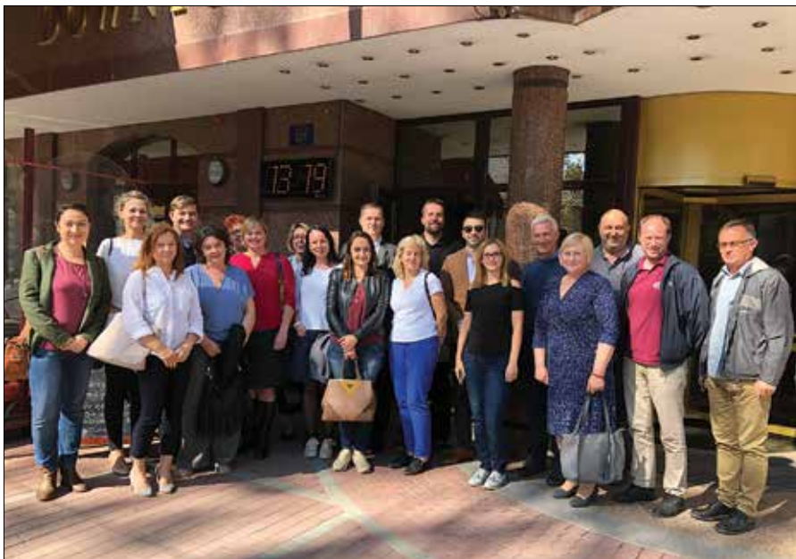
Predstavniki konzorcijskih partnerjev na prvem sestanku 10. oktobra v Sofiji

in storitve, ki jih ponuja posamezni velneški center, prav tako pa bi moral imeti dobro razvite komunikacijske veščine, ki so ključne pri