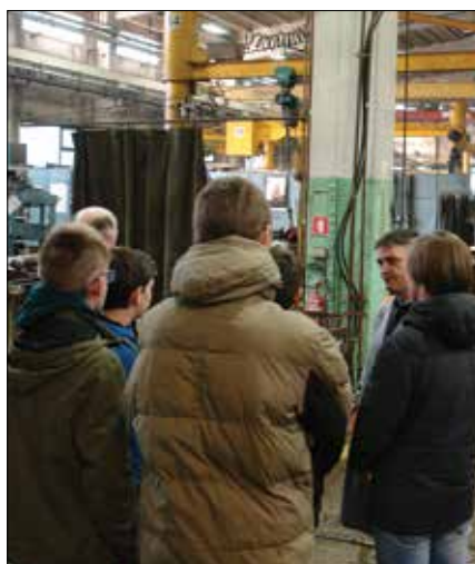
Skupina osnovnošolcev med ogledom delovnih mest v Premogovniku Velenje.

Kako naj se učenci in dijaki pravilno odločijo, kam naprej po osnovni ali srednji šoli? Ta odločitev je vedno težka, vsaj nekoliko lažja pa postane, če imajo mladi dovolj informacij o nadaljnjih možnostih izobraževanja in poklicih. Eden od najboljših načinov zbiranja takšnih informacij so obiski delovnih mest, kjer si lahko ogledajo, kaj zaposleni z določeno izobrazbo dejansko delajo.