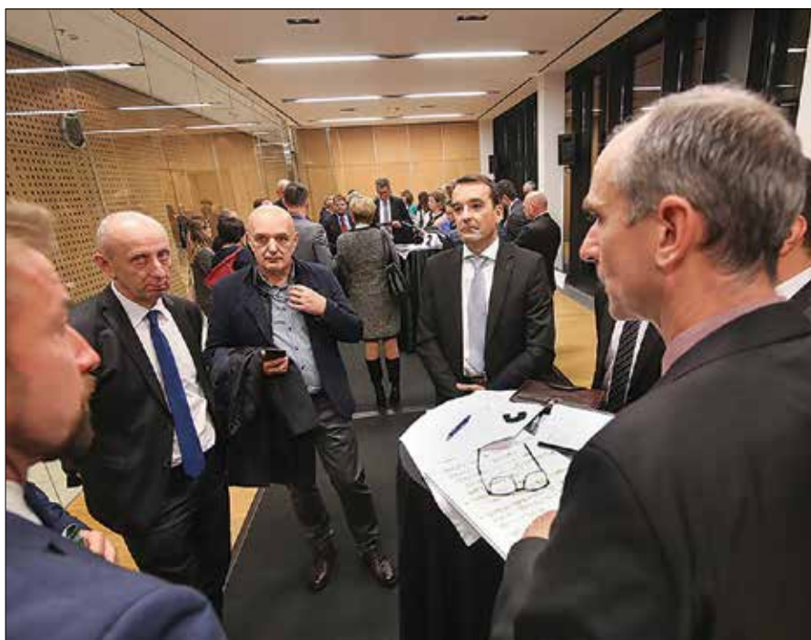
V razpravi po šestih tematskih področjih so aktivno sodelovali tudi predstavniki SŠGZ.