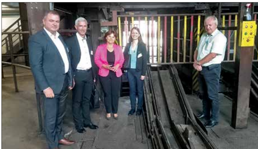
Komisija Gospodarske zbornice Slovenije med verifikacijo učnih mest v Premogovniku Velenje.

Verifikacije učnih mest opravljata na podlagi pooblastila države Gospodarska zbornica Slovenije in Obrtno-podjetniška zbornica Slovenije. Podjetje, ki želi verificirati učno mesto, se mora s predpisano vlogo obrniti na eno od pristojnih zbornic, nakar sledi komisijski ogled v podjetju. Če delodajalec izpolnjuje vse navedene pogoje, ga zbornica vpiše v register učnih mest in tako lahko veljavno sklepa vajeniške pogodbe. Komisija GZS, v kateri je sodeloval tudi direktor SŠGZ, je v jesenskem času verificirala učna mesta v več podjetjih v SAŠA regiji.