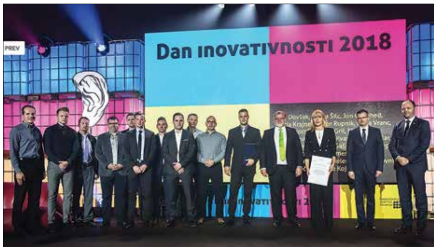
Inovatorji Gorenja so prejeli zlato priznanje za novo generacijo premijskih pralnih in sušilnih strojev ASKO Pro Home Laundry.

Tako kot v inovacijskih procesih sodelujejo različni ljudje, naj deluje tudi sodobna družba. Smo različni, a vendar smo povezani in odvisni drug do drugega. Pomembno je, da skrbimo za naše zaposlene, za naše državljane. Omogočiti jim moramo dostojno delo, življenje, priložnosti, da delajo tisto, kar jih ve-