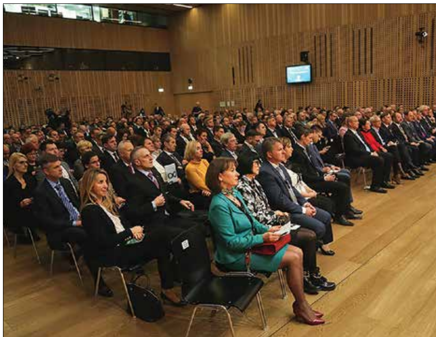
Pri oblikovanju ukrepov za gospodarsko odličnost je sodelovalo več kot 350 predstavnikov gospodarstva, sindikatov in vlade.