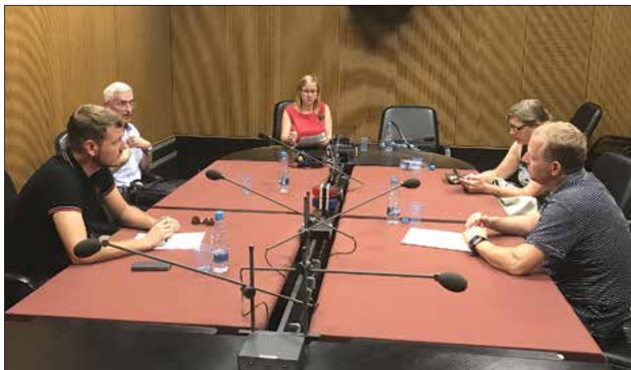
Tudi v letu 2018 se je SŠGZ veliko angažirala pri osveščanju širše javnosti o pomenu 3. razvojne osi; na fotografiji utrinek s snemanja radijske oddaje Studio ob 17h na Radiu Slovenija.

Na obisku na Ravnah na Koroškem 22. novembra je ministrica za infrastrukturo poudarila, da bo še letos znano, kako realna je časovnica iz Protokola o izgradnji 3. razvojne osi na Koroško. Roki, ki bodo predstavljeni javnosti, bodo realni in dosegljivi, hkrati pa bo znana informacija o pričetku postopkov za sprejem državnih prostorskih načrtov na odseku Slovenj Gradec-Ravne na Koroškem-Holmec.