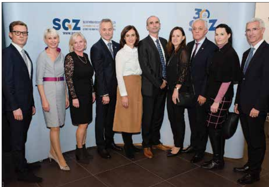
Spominska fotografija predstavnikov SŠGZ z vodstvom Slovenske gospodarske zveze ob njihovi 30-letnici.