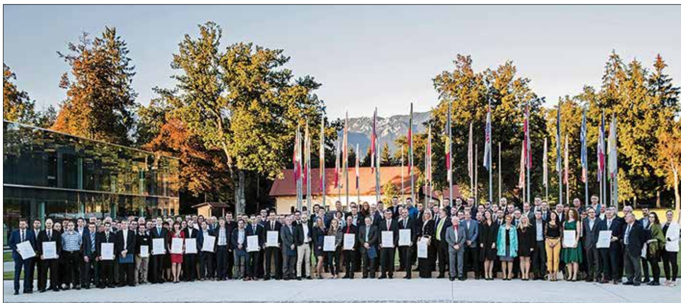
Skupinska slika vseh nagrajenih inovatorjev na nivoju nacionalne gospodarske zbornice.

Letos se je za priznanja na nacionalni ravni potegovalo 42 najboljših inovacij iz vse Slovenije. GZS je nagradila tudi najboljšo inovacijo leta po izboru javnosti – inovacijo podjetja TPV Integriran zvezni zadrževalnik vrat, delujoč v širokem temperaturnem območju. Inovatorji Gorenja so prejeli zlato priznanje za novo generacijo premijskih pralnih in sušilnih strojev ASKO Pro Home Laundry in srebrno priznanje za novo generacijo samostojnih štedilnikov FS16, inovatorji BSH Hišnih aparatov pa so prejeli srebrno priznanje za samostojni popolnoma avtomatski kavni aparat TE 300.